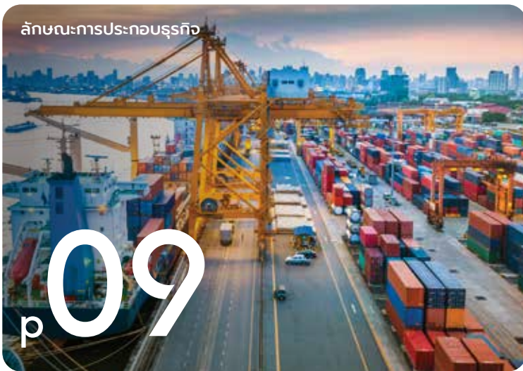
ลักษณะการประกอบธุรกิจ