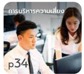
การบริหารความเสี่ยง