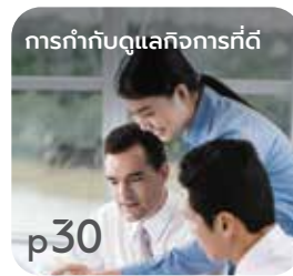
การทำกับดูละกิจการที่ดี