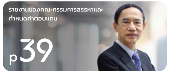
รายงานของคณะกรรมการสรรหาและ กำหนดค่าตอบแทน