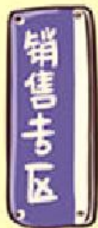
销售专区或 销售专柜提示牌