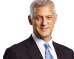
集團行政總裁 Bill Winters, CBE 第15項決議案