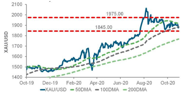
黃金兌美元日線圖