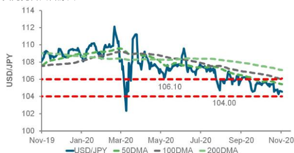
美元兌日圓日線圖