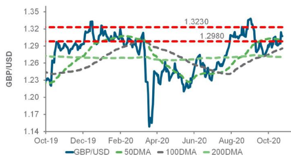
英鎊兌美元日線圖