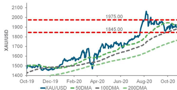
黃金兌美元日線圖